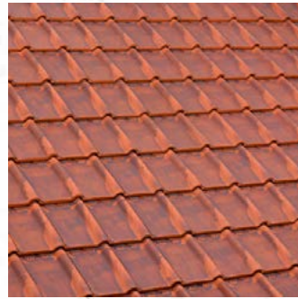
AMA RANT RUSTIEK*

Om de lichte kleurverschillen eigen aan het natuurlijke basisproduct klei en aan het productie systeem te verminderen, raden wij U aan de producten goed te mengen tijdens de verwerking. De kleuren op de foto's zijn niet contractueel en kunnen niet waarheidsgetrouw weergegeven worden. Om Uw keuze te bevestigen, aarzel niet om onze dienst «Verzending Monsters» te contacteren.