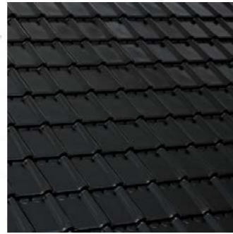
ZWART EN GOBE*